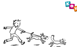
Niet te houden

Week 21 (25/05 - 28/05) – Niet te houden Handelingen 4: 1-22, 4: 32-37 en 5: 17-26 Jezus is naar de hemel gegaan. Maar toch is zijn verhaal nog lang niet afgelopen! Na Pinksteren gaan de leerlingen van Jezus door met wat Jezus begonnen is. De leiders van het land vinden het niet goed, maar ze zijn niet te houden.