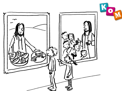
Wie is Jezus?