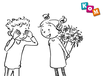
Open je ogen

Het wordt donker, zomaar midden op de dag. Jezus sterft. Hij wordt begraven in een graf met een steen ervoor. Maar daar in het donker zal Jezus niet blijven. Op Paasmorgen overwint het leven. Alsof God opnieuw zegt: 'Er zij licht!'