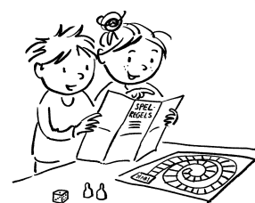
Zo gaan we het doen

Mozes geeft in zijn eentje leiding aan het hele volk. Dat kan zo niet langer, vertelt zijn schoonvader Jetro hem. Mozes stelt mensen aan die hem helpen. In de woestijn geeft de Heer zijn volk tien geboden, als tien leefregels voor onderweg. Die regels zullen hen verder brengen.