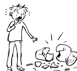
Dat kun je niet maken

Mozes gaat de berg op, waar hij praat met de Eeuwige. Intussen maken de Israëlieten een gouden kalf dat ze aanbidden als een god. Maar God kun je niet zelf maken. Als Mozes terugkomt, gooit hij de stenen tafelen kapot: zó kwaad is hij. Ligt het verbond nu letterlijk en figuurlijk in scherven? En is het nog weer goed te maken?